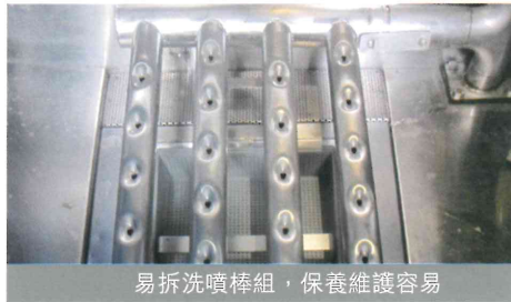
易拆洗噴棒組，保養維護容易