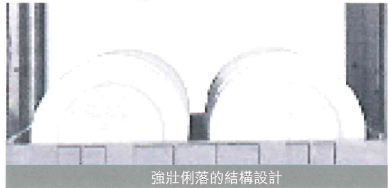
強壯俐落的結構設計