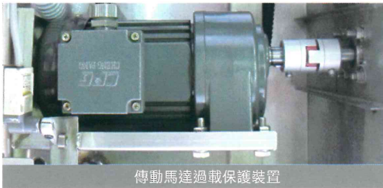
傳動馬達過載保護裝置