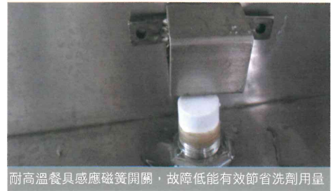
耐高溫餐具感應磁簧開關，故障低能有效節省洗劑用量