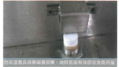
耐高溫餐具感應磁簧開關，故障低能有效節省洗劑用量