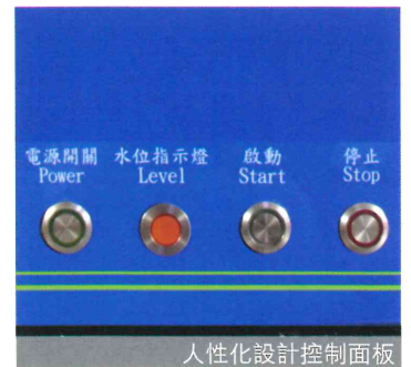
人性化設計控制面板