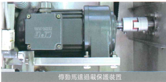
傳動馬達過載保護裝置

市場多年嚴峻考驗及淬煉下，不斷研發改良，強化結構性，提高洗滌品質。不僅有在地生產優勢，價格更具競爭力外，並通過歐盟CE認證、食品安全衛生管理HACCP認證，行銷多國，真正做到國際規格本土價格。