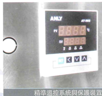
精準溫控系統與保護裝置