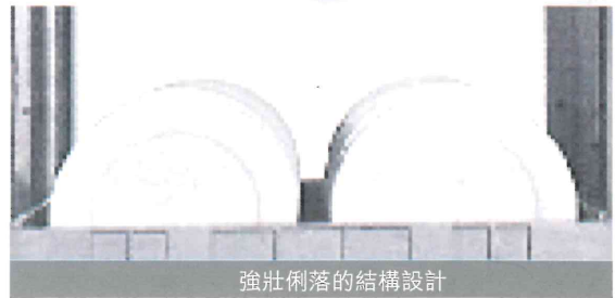
強壯俐落的結構設計